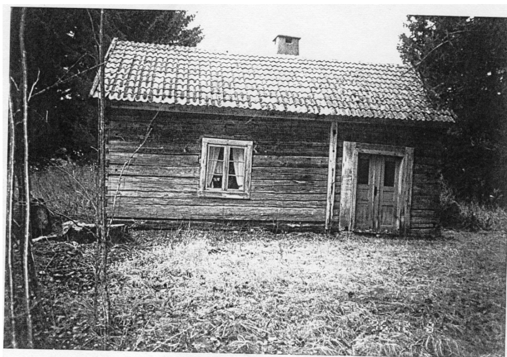
Mellangården i Ramberstorp 1998 /HS