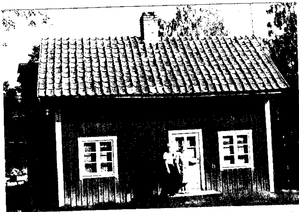
HÄLLEMON FLYTTAD TILL ÖMBERG